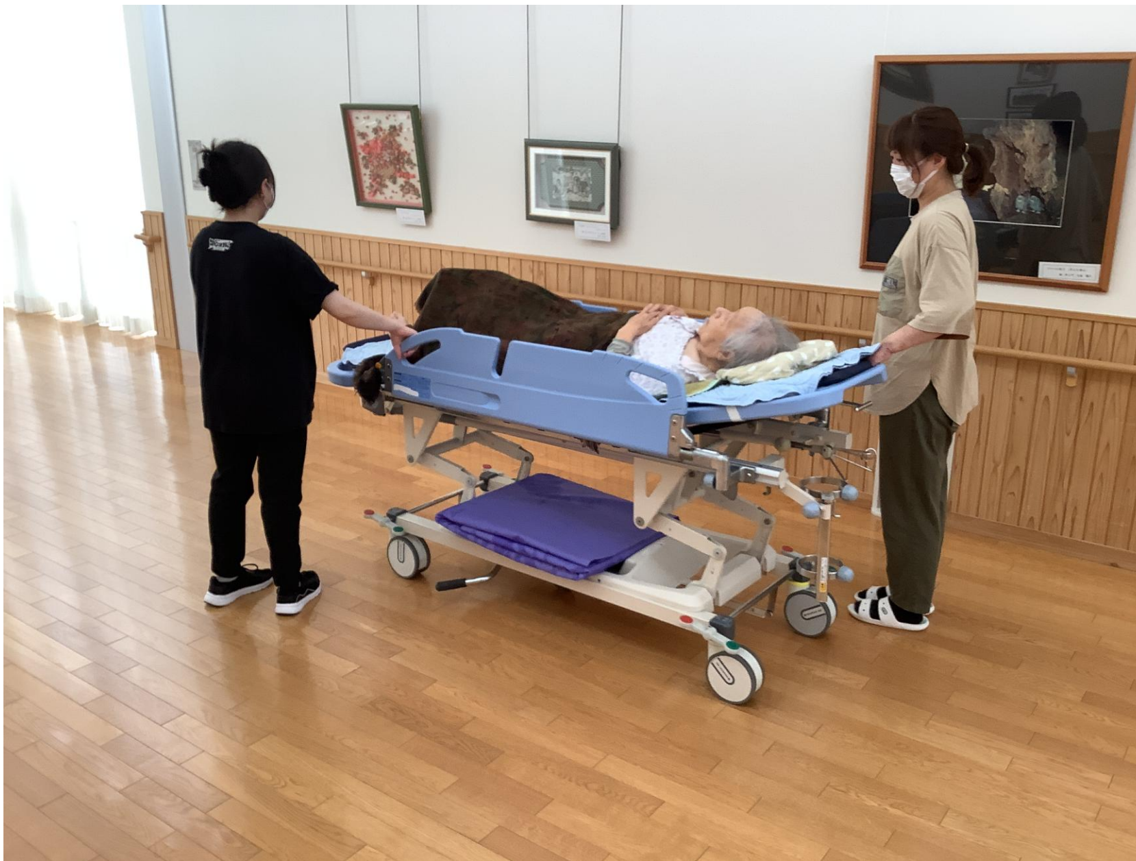
ユニットから浴室間の誘導