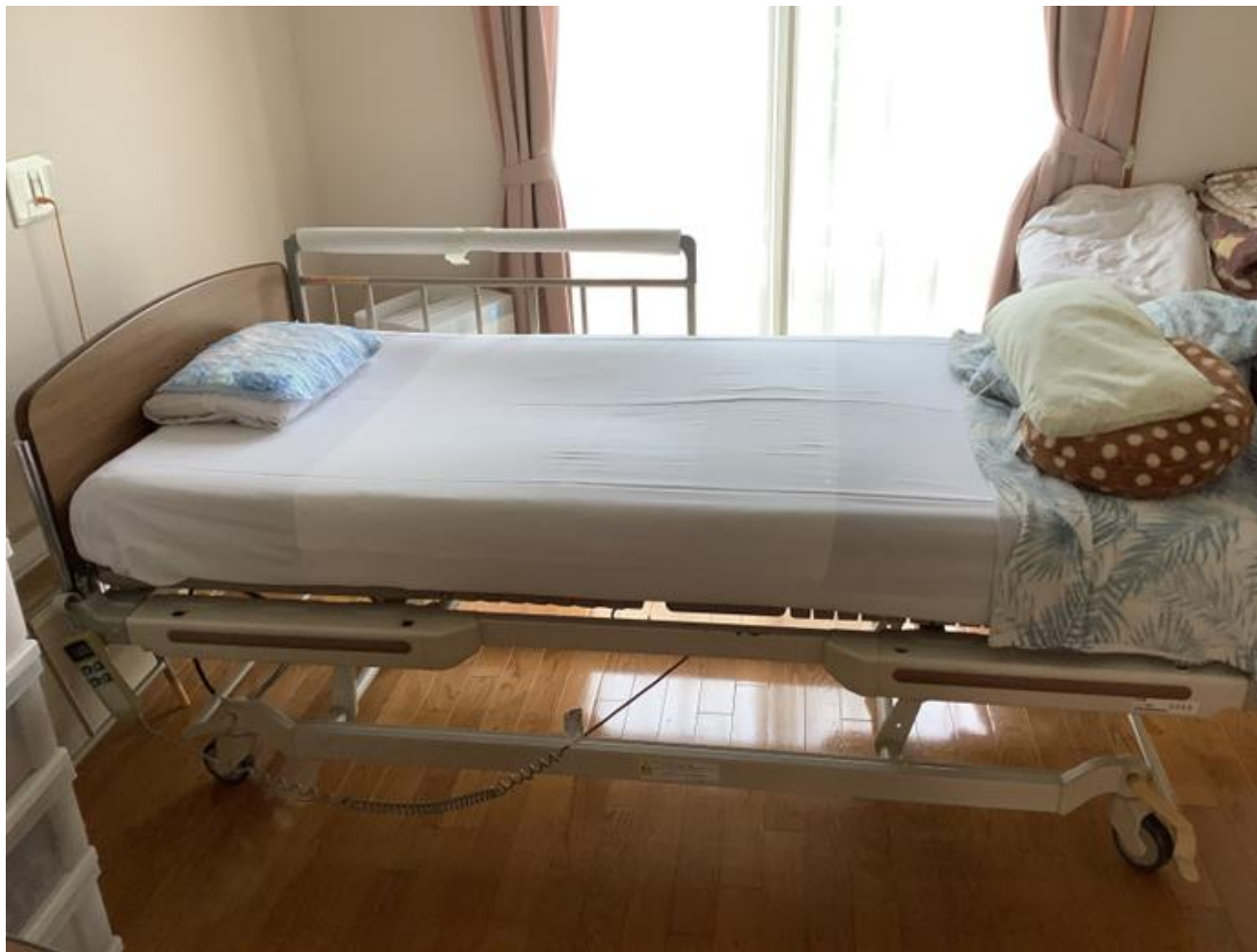
シーツ交換・洗濯物整理