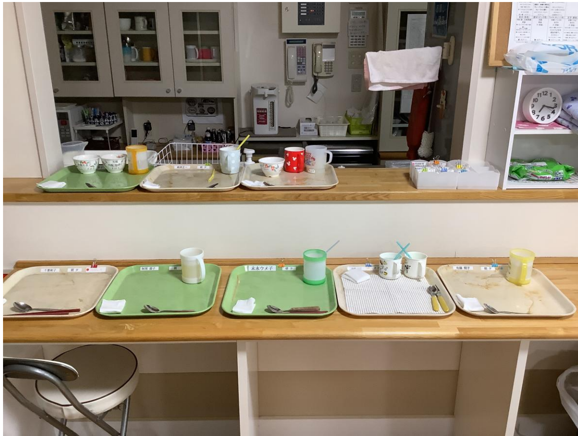
食事前（準備） お膳の準備・水分の準備