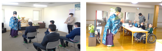
△ 安全祈願祭 各ユニット祈願して頂きました