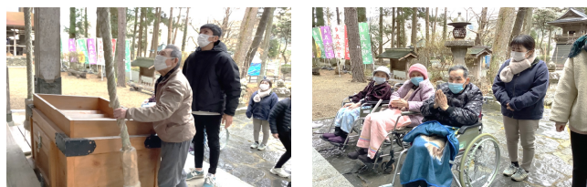
△ 初詣 健康で過ごせますように