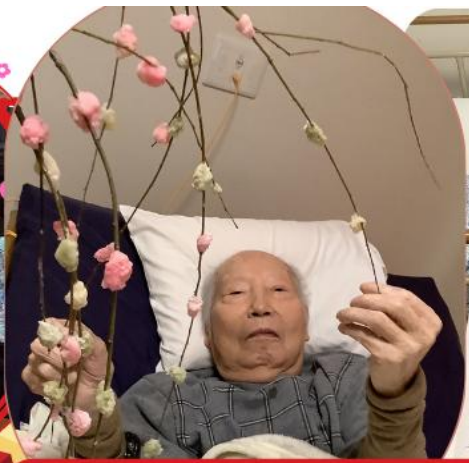
お正月ならではの1ショット