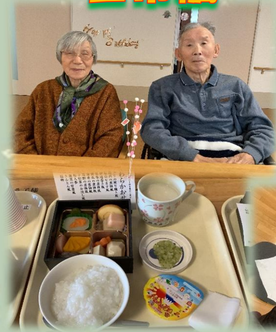
おめでとうございます！！