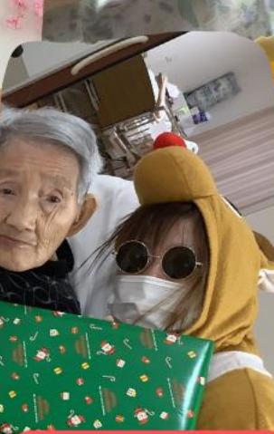
わくわくな クリスマスプレゼントも!!