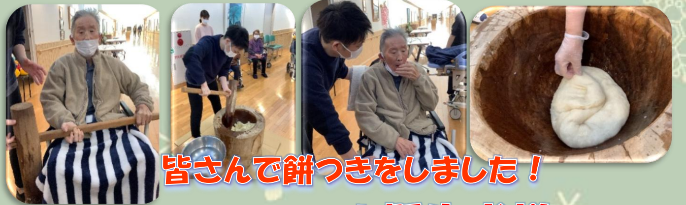
皆さんで餅つきをしました！