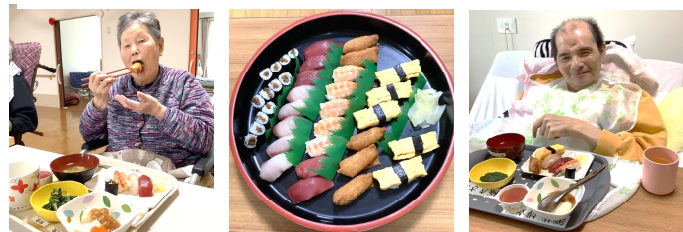
△ 新年会 にぎり寿司でおいしい笑顔